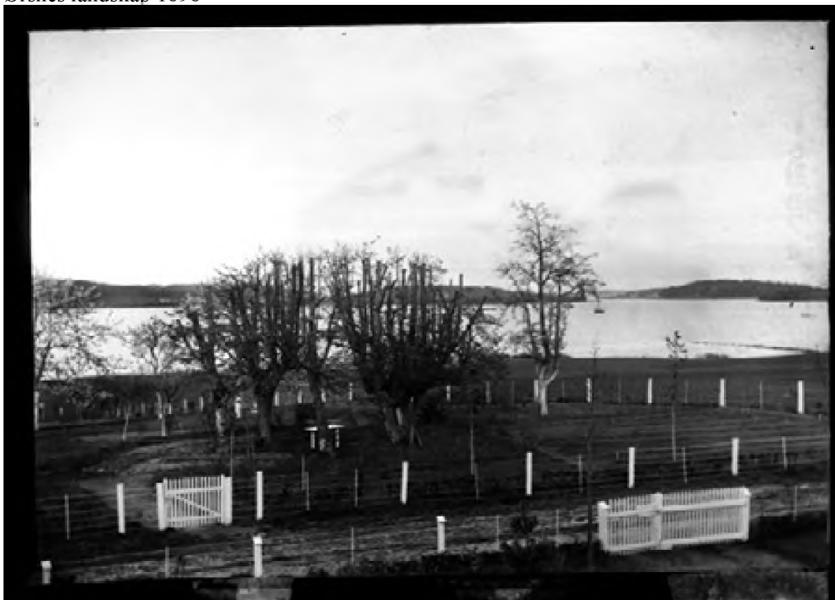
Ørsnes landskap 1898