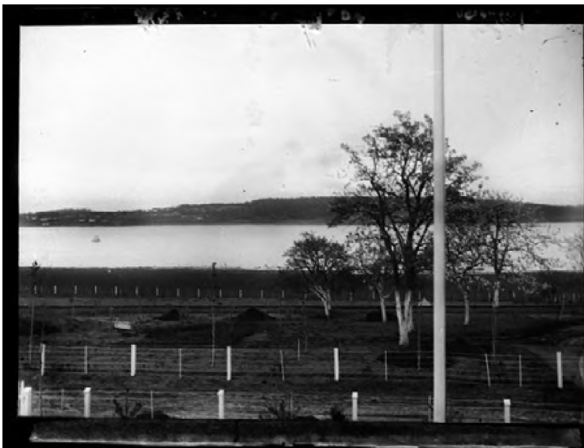
Ørsnes landskap 1898