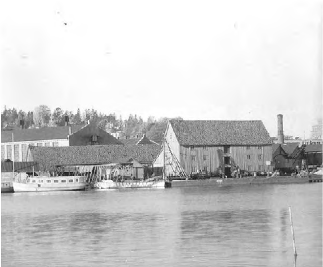
Riggerloftet på Kaldnes 1947