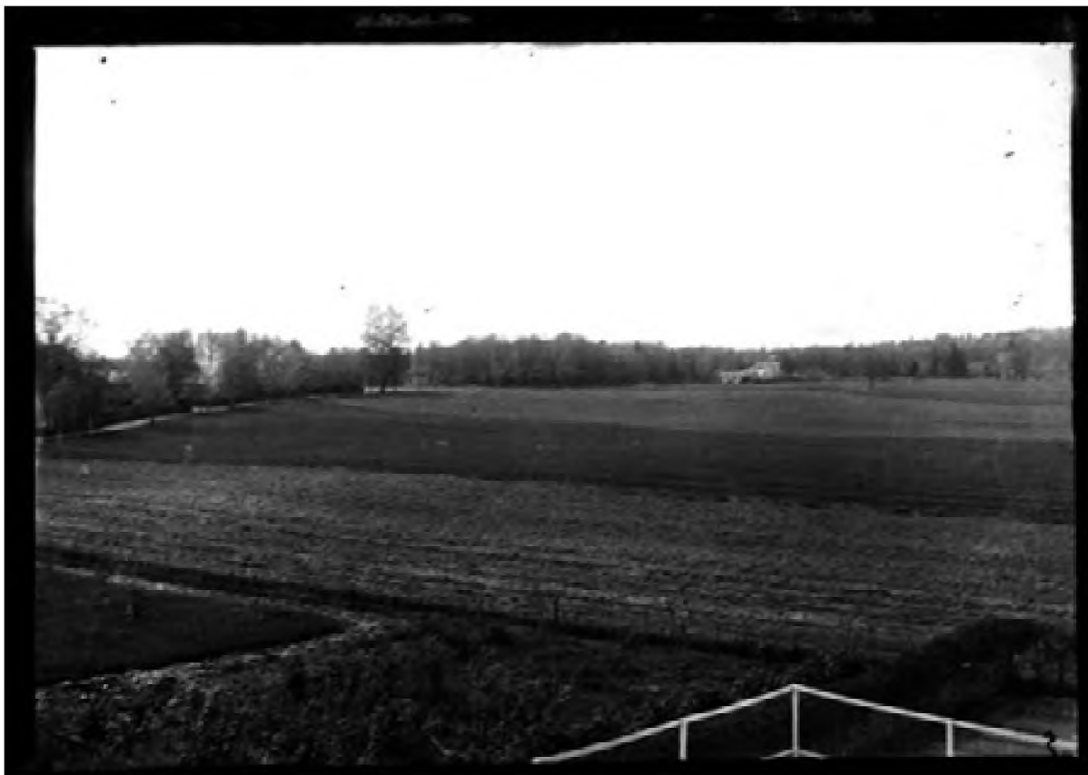
Ørsnes landskap 1898