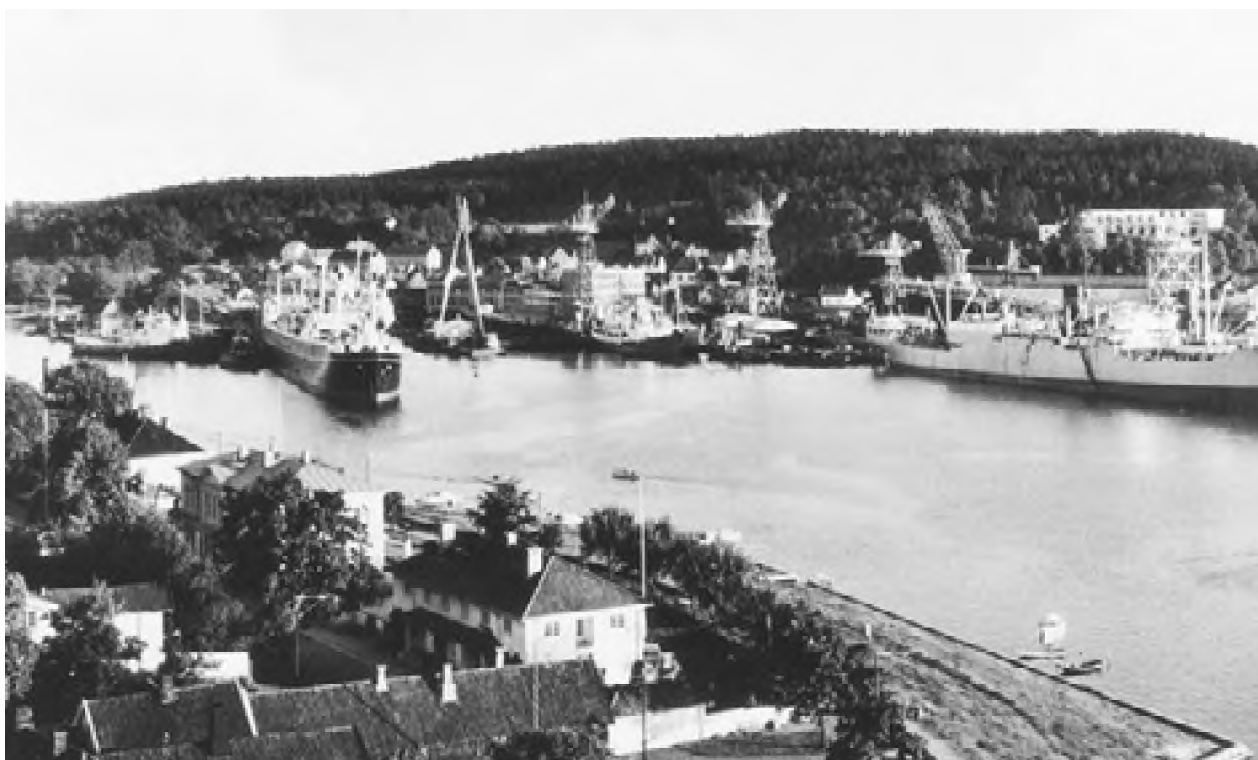
Kaldnes mek. verksted 1950