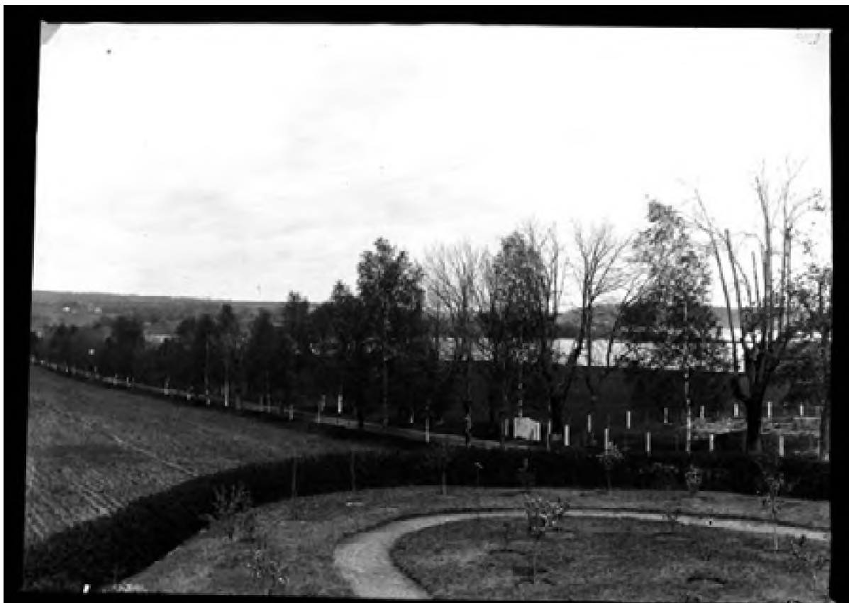
Ørsnes landskap 1898