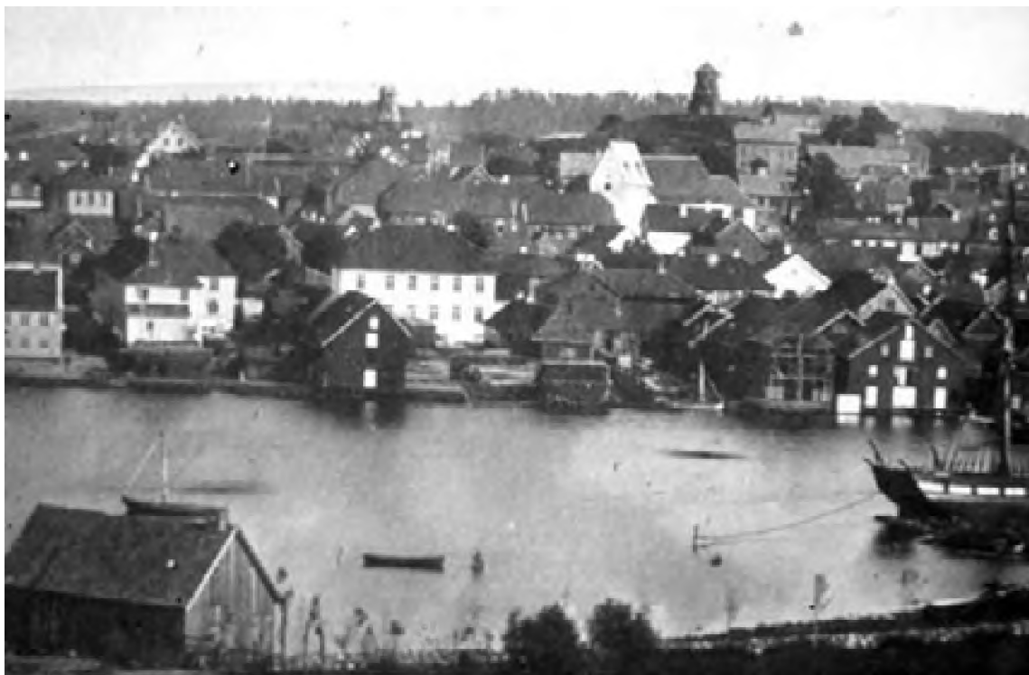
Mariakirken på torvet som ble revet for å bygge byens nye rådhus på torvet