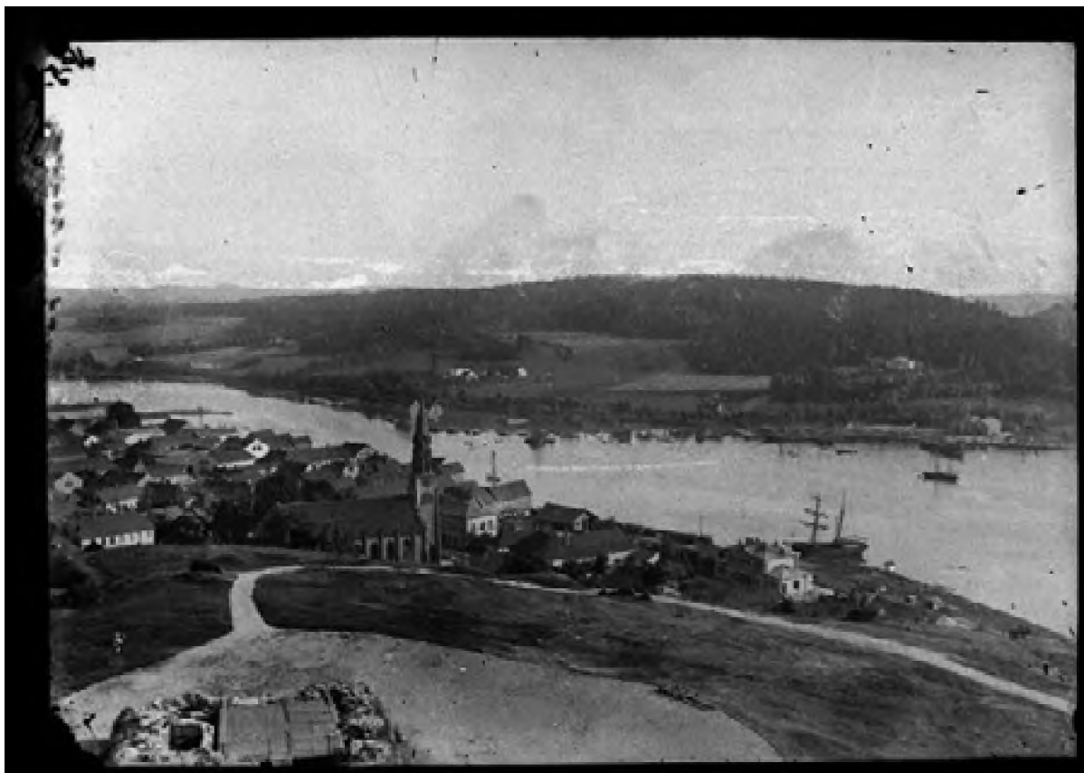
Bybilde fra Slottsfjellet 1900