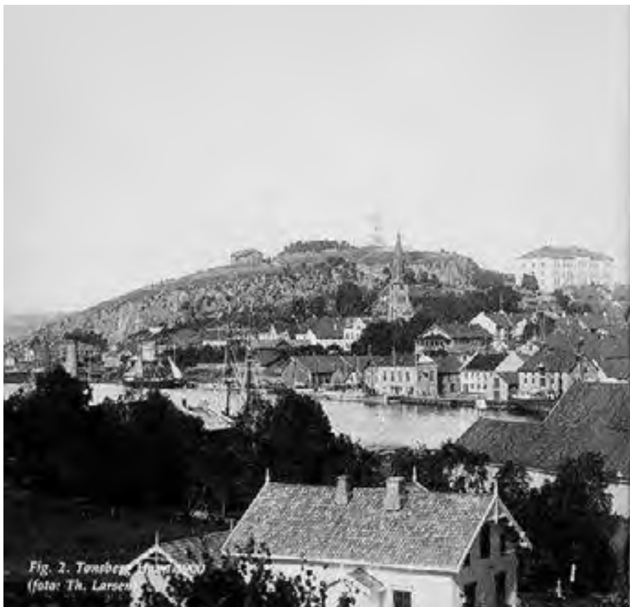
Tønsberg havn (1900)