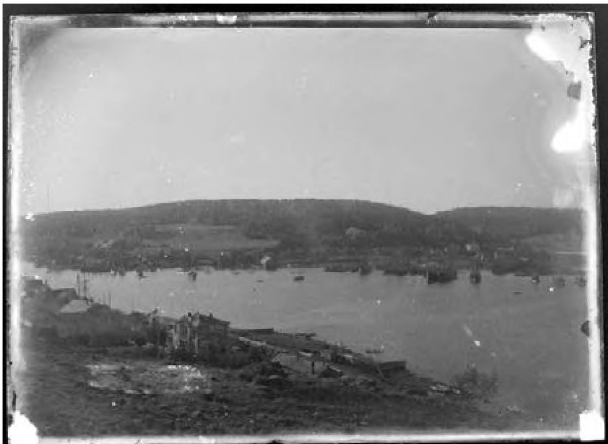
Bybilde fra Slottsfjellet 1900