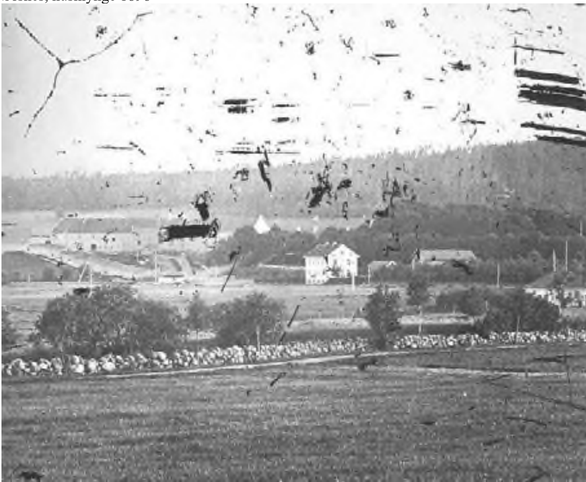
Tønsberg Bryggeri 1860