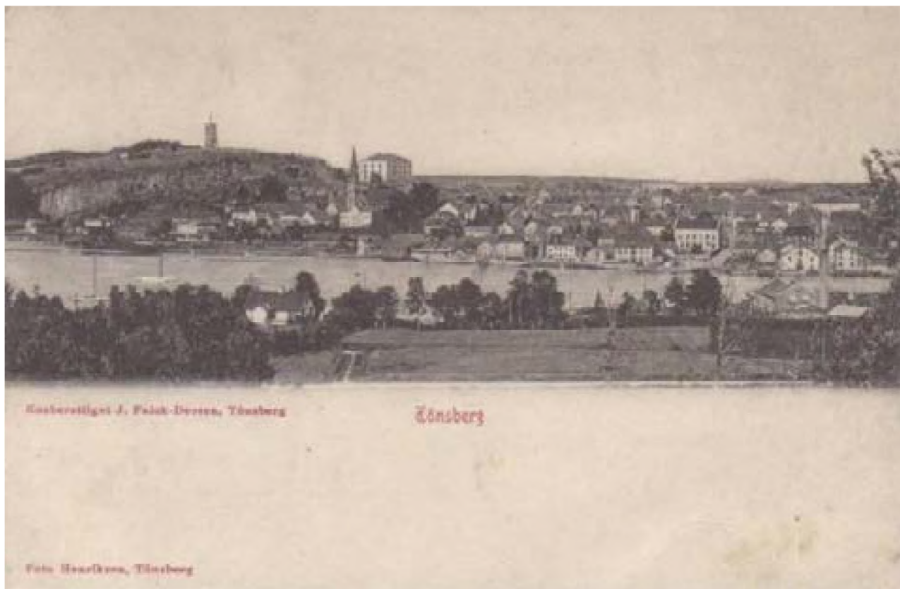
Tønsberg med Slottsfjellet i bakgrunnen - antagelig rundt 1900 ...