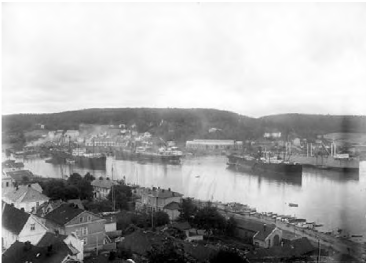
Kaldnes og havnen 1929