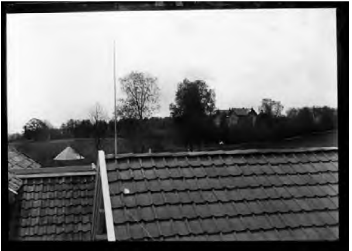
landskap 1898 Ørsnes, husklynge 1898