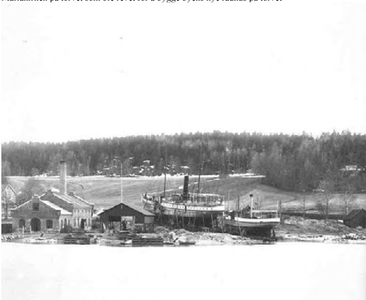
Rutebåtene Jarlsberg og Kvikk overhales på Kaldnes 1901.