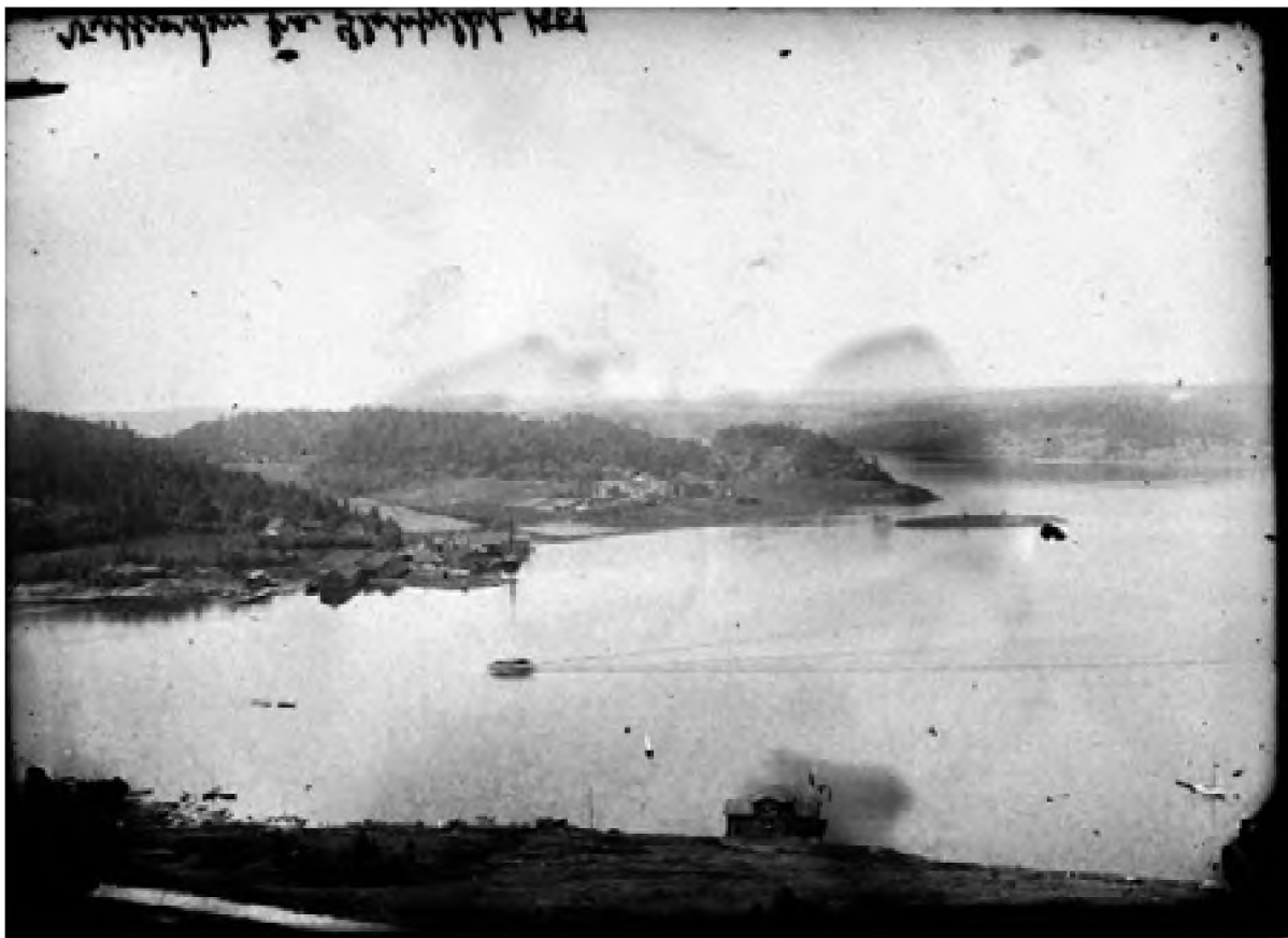
Bybilde fra Slottsfjellet 1888