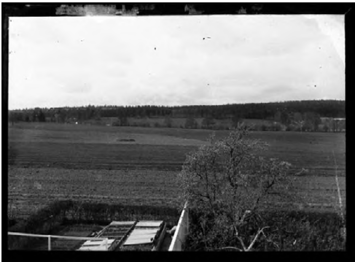
Ørsnes landskap 1898