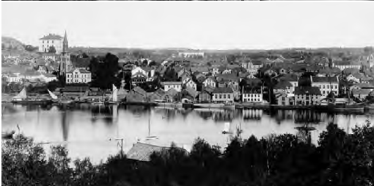
Tønsberg havn 1900, et usedvanlig klart, oversiktiglig bilde av et motiv som går igjen her. Se hvor mye Slottsfjellskolen dominerte bybildet.