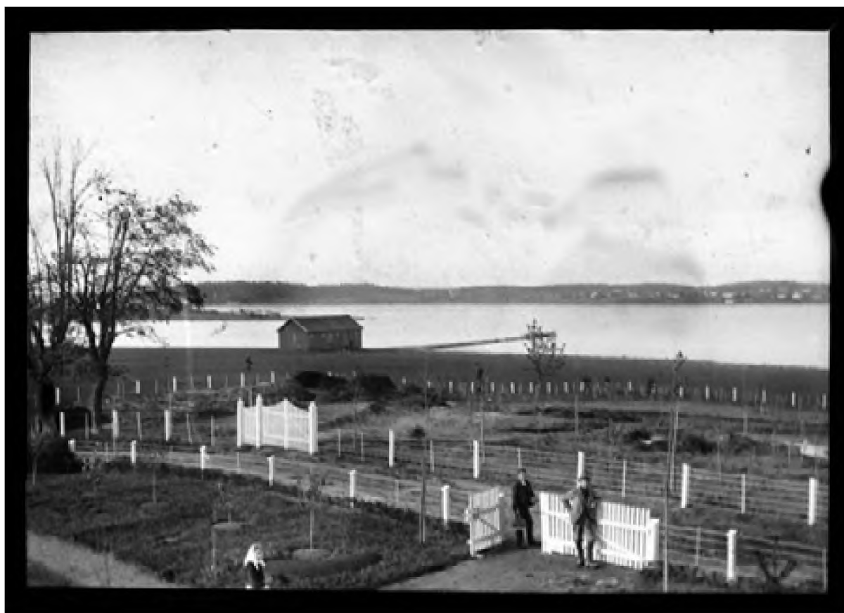
Ørsnes landskap 1898