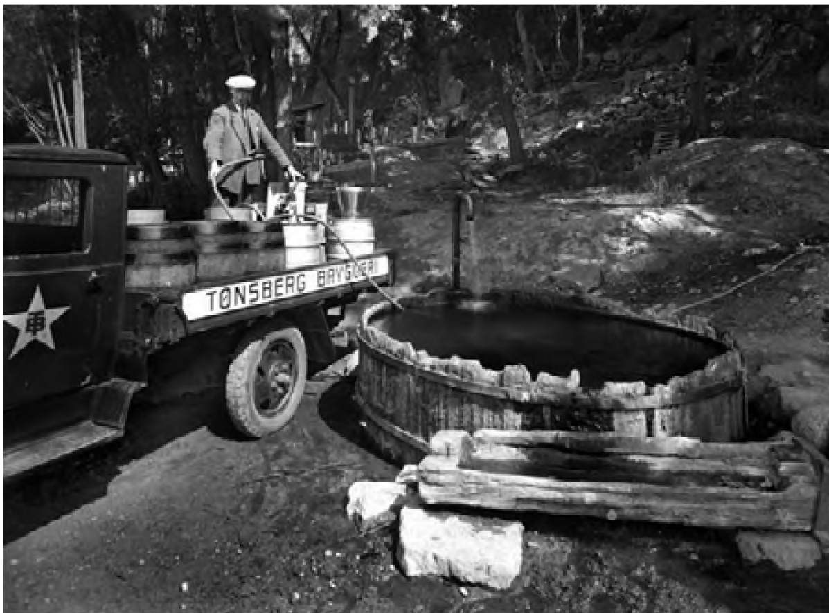
Tønsberg bryggeri henter vann 1936