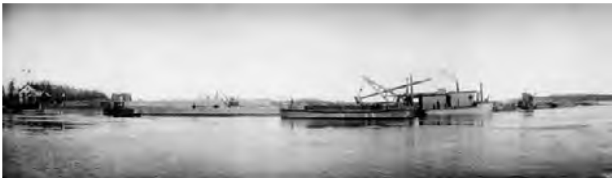
Utgravning av kanalen 1896