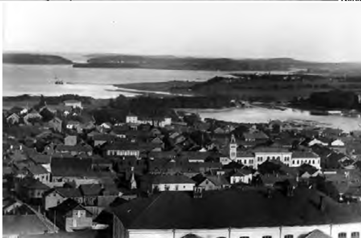
hovedgård Bybilde 1892