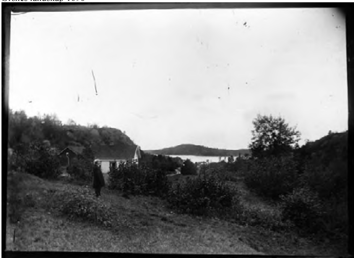
Ørsnes landskap 1898