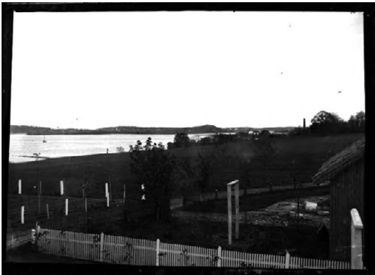
Ørsnes landskap 1898